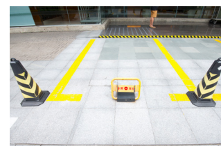
Gestión de aparcamiento privado.