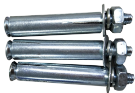
Tornillos de expansión