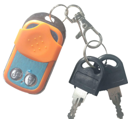
Control remoto y llaves